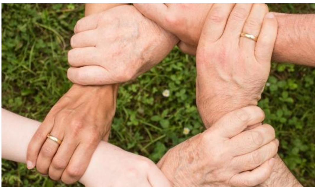
Figuur 2 Netwerk tegen armoede

In 2025 zijn er intensieve maar positieve gesprekken gevoerd tussen SUN Nederland (SUNN) en de bureaus die zich hebben verenigd in de Vereniging Urgente Noden Nederland (VUNN). Waar SUNN zich oorspronkelijk vooral bezighoudt met oprichten en faciliteren, is de dienstverlening van de organisatie inmiddels gericht op belangenbehartiging, kennis verspreiding, lobby, opleiding en training. Aangezien het een stichting betreft is het niet mogelijk om namens de bureaus te spreken. Dat democratisch deficit is de leden van VUNN een doorn in het oog. De gesprekken van 2025 zijn erop gericht geweest om de bureaus een stem te geven in het beleid van SUNN. Een werkgroep van SUNN-medewerkers, VUNN-leden en een vertegenwoordiging van niet-aangesloten bureaus, rondt naar alle waarschijnlijkheid in 2026 deze reeks van gesprekken positief af om te komen tot een democratischer organisatie.